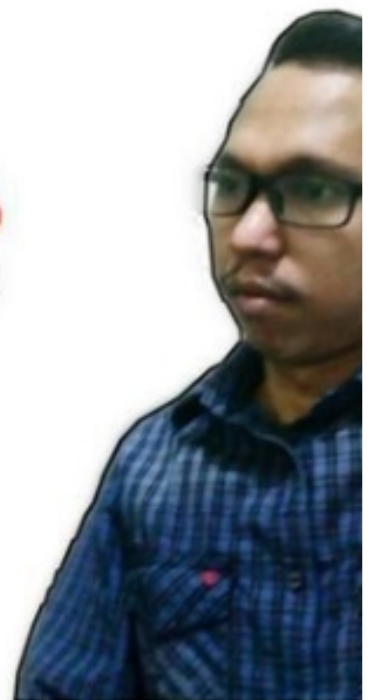
Jajang Nu Koordinator Inve

KAB.BOGOR,- Center for Budget Analysis (CBA) turut menyoroti terkait proyek peningkatan jalan Putat Nutug-Kuripan Kec.Ciseeng Kab.Bogor yang dinilai banyak kejanggalaan saat proses lelang tender. Di tambah dari hasil liputan media